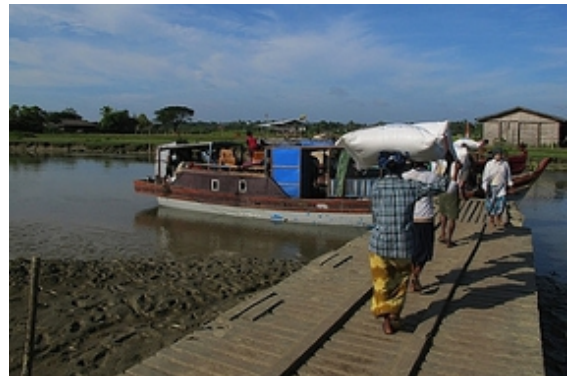
Systematische Vertreibung: Muslimische Rohingya in Myanmar werden immer wieder Opfer gewaltsamer Übergriffe. Foto: Marcus Prior/WFP/EU Humanitarian Aid and Civil Protection; Quelle: Flickr; Lizenz: CC-BY-SA

Human Rights Watch fordert die Aufklärung der Vorfälle durch eine internationale Untersuchungskommission und die sofortige Änderung des Staatsbürgerschaftsgesetzes von 1982. Dieses definiert die Staatsbürgerschaft aufgrund